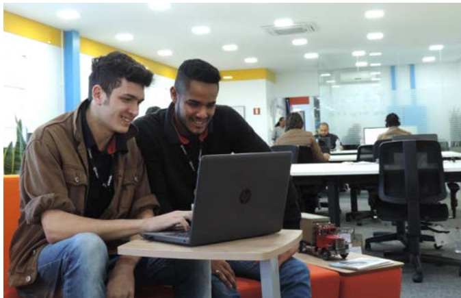
O CEIMP possui formato Open Space, que permite mais integração do time de colaboradores

O Departamento de Transformação Digital e Inovação é responsável pela gestão da TI, incluindo: o desenvolvimento e suporte aos sistemas, infraestrutura, soluções de telecomunicações e suporte técnico.