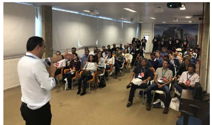
Recepção na unidade de Campinas

O grupo teve a oportunidade de ver na prática a aplicação da metodologia Lean na nossa operação.