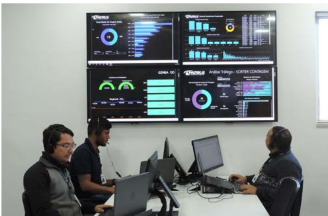
Acompanhamento das carretas em tempo real

A Central de Tráfego conta com uma torre de controle, de onde todas as viagens de transferências entre filiais, coleta e entrega em clientes são 100% monitoradas. O time trabalha de forma online, por meio de dashboards e diversas outras tecnologias que permitem foco total no cumprimento dos prazos de entrega.