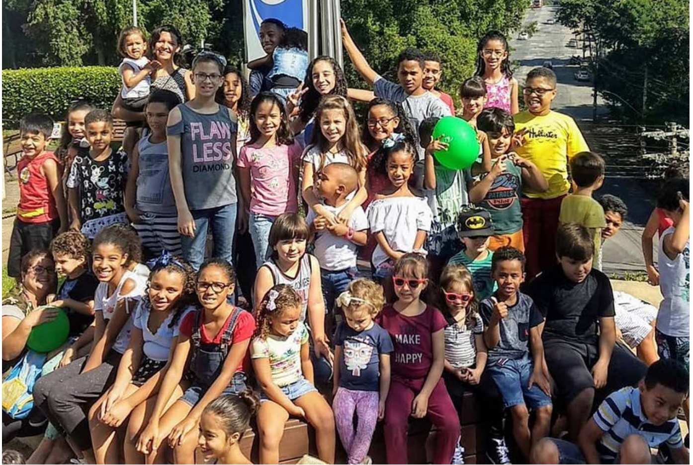
Filhos de colaboradores que participaram da Oficina de Sustentabilidade Júnior em Contagem

Promover ações sustentáveis e que resultem na conscientização e preservação dos recursos naturais e do meio ambiente é um dos propósitos da Patrus Transportes. Por isso, realizamos anualmente a Oficina de Sustentabilidade, impactando tanto nossos colaboradores quanto seus familiares, para conscientizar a todos sobre a importância dos 3 pilares da sustentabilidade.