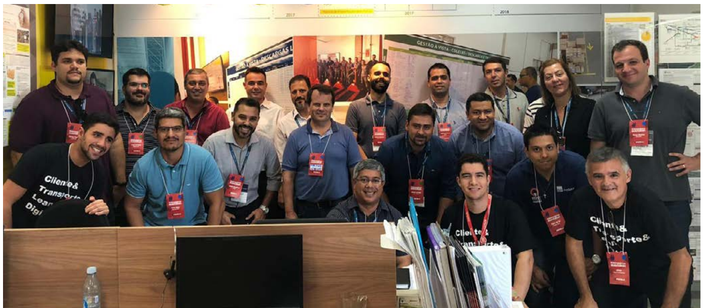
Visita de 40 executivos participantes do Seminário na unidade da Patrus Transportes em Campinas (SP)