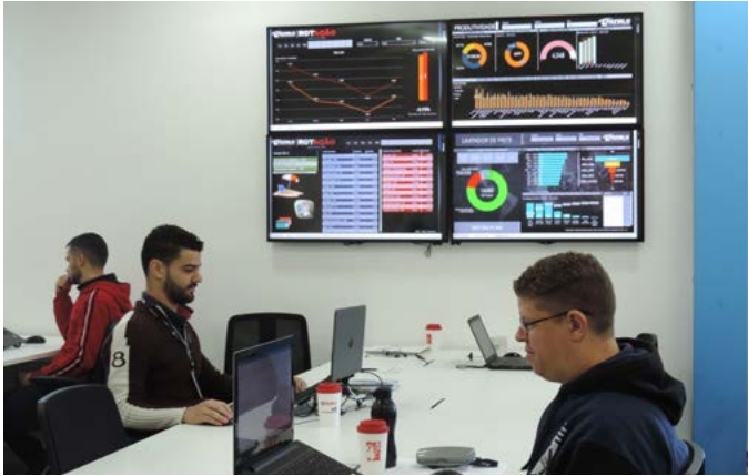
As Torres de Controle do OPEX permitem o acompanhamento dos processos operacionais

O departamento de Excelência Operacional (OPEX) atua como uma central de inteligência operacional, revendo todo o histórico de vários processos, como: prazos de entrega, abrangência de regiões de atendimento, roteirização eficiente, entre outros.