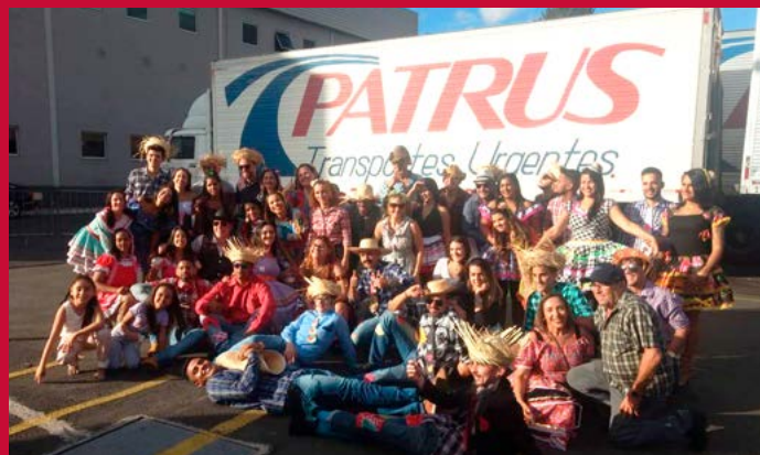
Quadrilha do Arraiá do Reformar