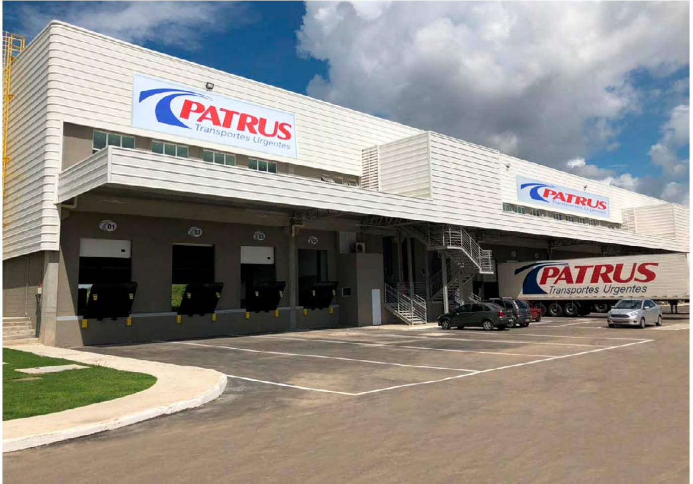
Av. Chef s/n - Parque dos Faroes - Nossa Senhora do Socorro - SE (acesso pela BR 101)

Investimos na ampliação do terminal de Aracaju (SE), com 2.700m 2 de terminal e 20 docas para carregamento simultâneo.